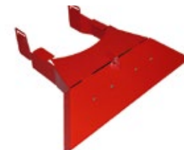
AMPLIAMENTO MODULARE DEL- LA MACCHINA