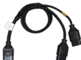
CAVO DI PROLUNGA PER SENSORI MX