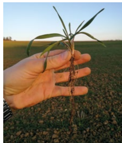
Kulturpflanze ist im Regelfall fest verwurzelt